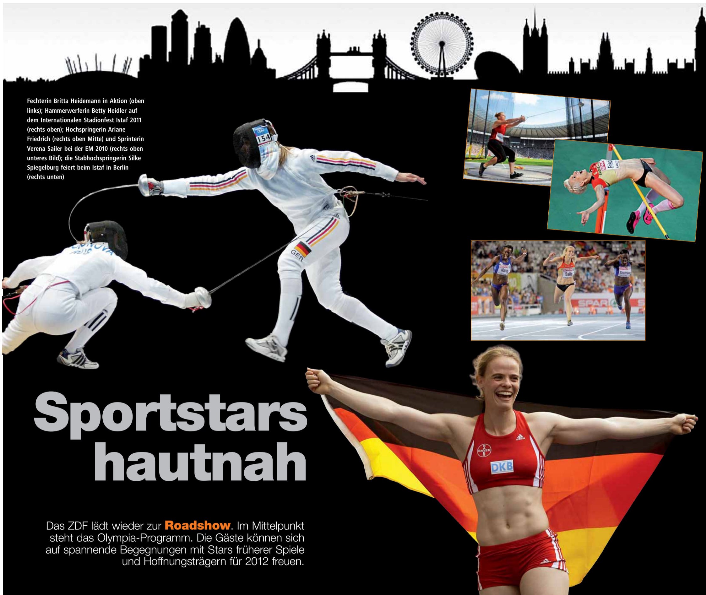
Fechterin Britta Heidemann in Aktion (oben links); Hammerwerferin Betty Heidler auf dem Internationalen Stadionfest Istaf 2011 (rechts oben); Hochspringerin Ariane Friedrich (rechts oben Mitte) und Sprinterin Verena Sailer bei der EM 2010 (rechts oben unteres Bild); die Stabhochspringerin Silke Spiegelburg feiert beim Istaf in Berlin (rechts unten)