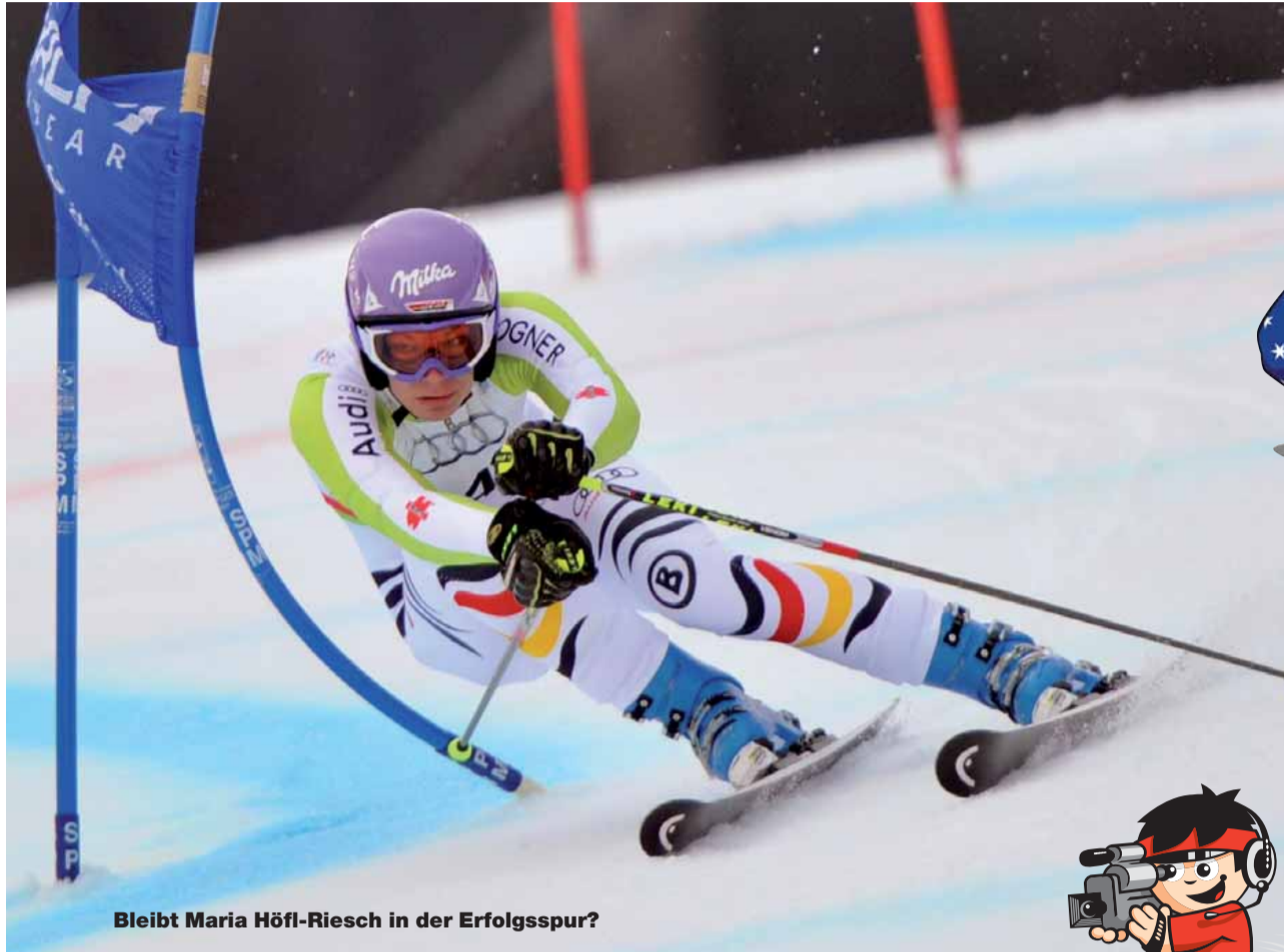
Bleibt Maria Höfl-Riesch in der Erfolgsspur?

Attraktiv für Werbungtreibende: „Single Splitscreen“-Pakete. Nachdem diese für Biathlon und den alpinen Skisport bereits verkauft sind, sind noch interessante Pakete im Skisprung zu haben.