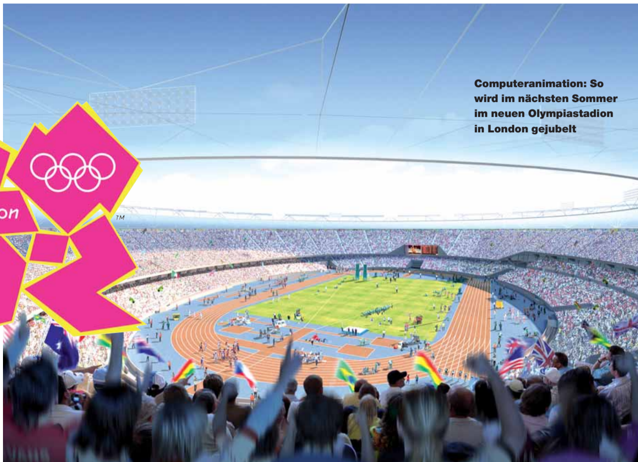
Computeranimation: So wird im nächsten Sommer im neuen Olympiastadion in London gebuhlt

Noch verrät Scholten nicht, welche Besonderheiten die Berichterstattung kennzeichnen werden. Fest steht lediglich: Es wird, anders als bei der Fußball-WM in Südafrika, keine Sondersendungen über das Gastgeberland geben – so unbe-