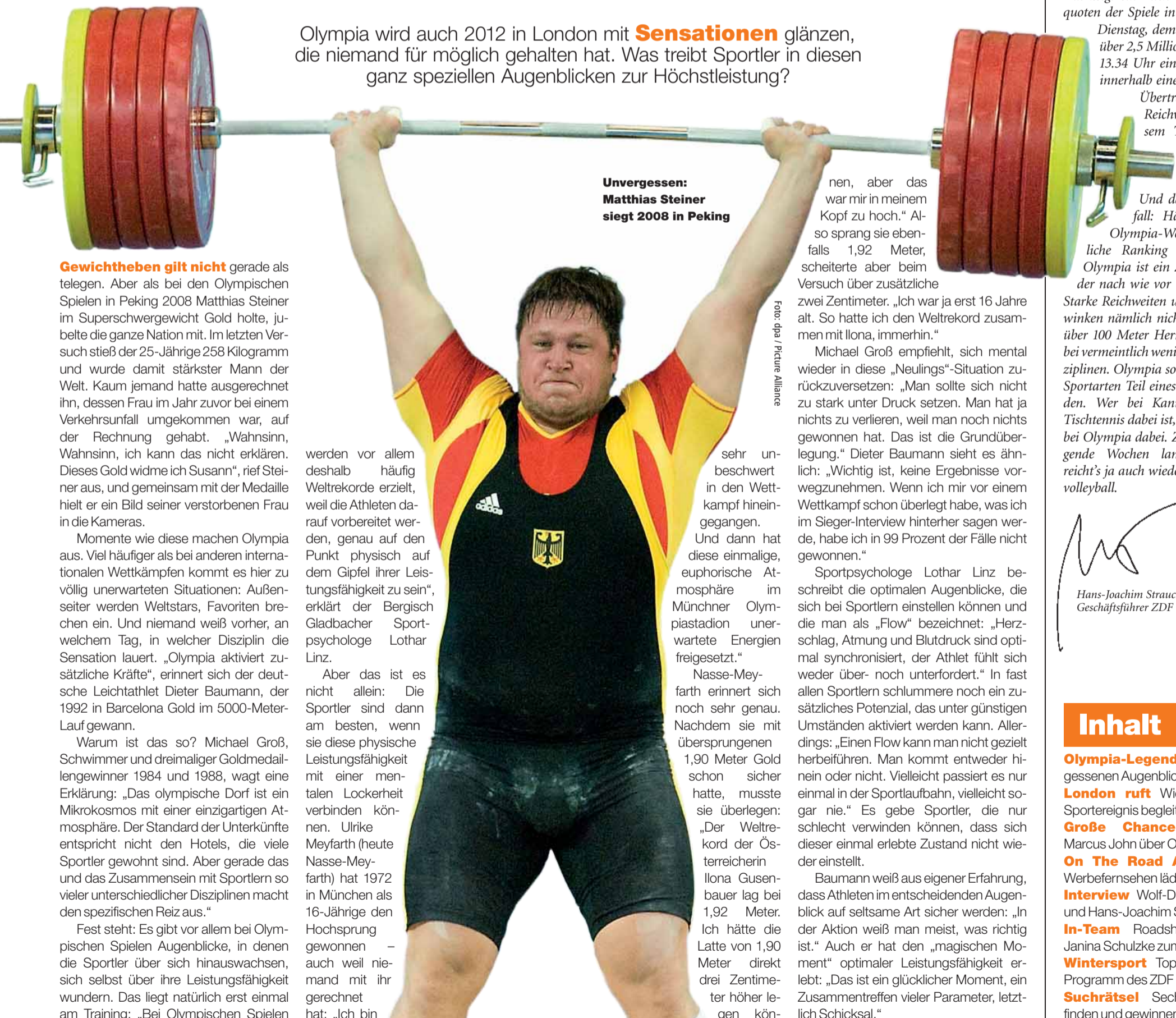
Unvergessen: Matthias Steiner siegt 2008 in Peking

Olympia wird auch 2012 in London mit Sensationen glänzen, die niemand für möglich gehalten hat. Was treibt Sportler in diesen ganz speziellen Augenblicken zur Höchstleistung?