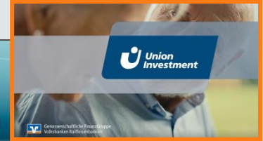
19:21:28 Uhr Sponsor Outro

Exklusivität, unverwechselbarer Auftritt mit positivem Imagetransfer