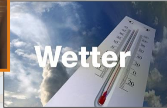
19:20:22 Uhr Wetter