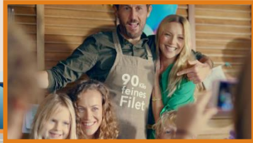
19:20:15 Uhr Sponsor Intro