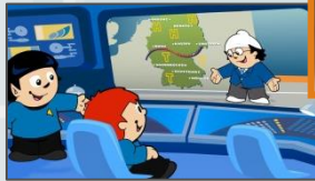
19:20:12 Uhr Mainzelmännchen

Ihre Botschaft eingebunden in unser Nachrichtenumfeld