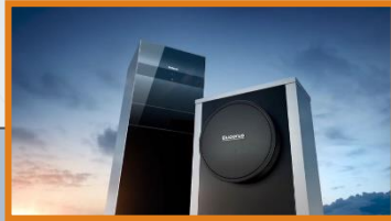
19:20:15 Uhr Sponsor Intro