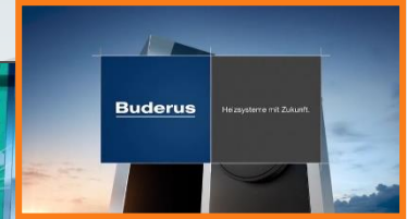
19:21:28 Uhr Sponsor Outro

Exklusivität, unverwechselbarer Auftritt mit positivem Imagetransfer