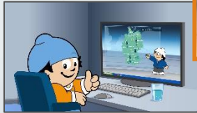
19:20:12 Uhr Mainzelmännchen