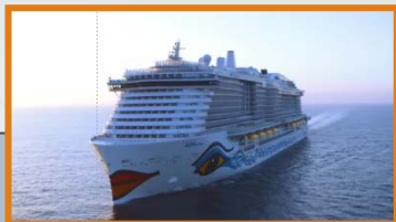
19:20:15 Uhr Sponsor Intro