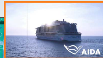
19:21:28 Uhr Sponsor Outro

Exklusivität, unverwechselbarer Auftritt mit positivem Imagetransfer