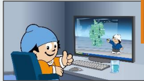
19:20:12 Uhr Mainzelmännchen