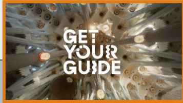
19:20:15 Uhr Sponsor Intro