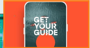
19:21:28 Uhr Sponsor Outro

Exklusivität, unverwechselbarer Auftritt mit positivem Imagetransfer