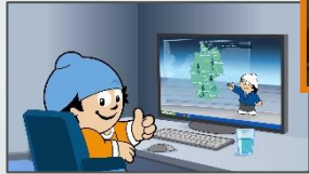
19:20:12 Uhr Mainzelmännchen