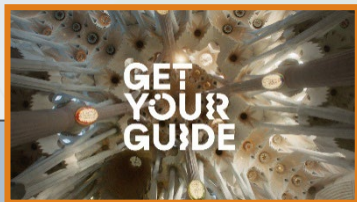
19:20:15 Uhr Sponsor Intro