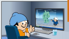
19:20:12 Uhr Mainzelmännchen