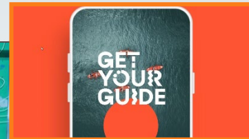
19:21:28 Uhr Sponsor Outro

Exklusivität, unverwechselbarer Auftritt mit positivem Imagetransfer