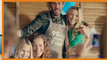
19:20:15 Uhr Sponsor Intro