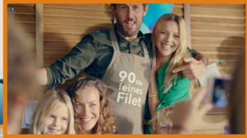
19:20:15 Uhr Sponsor Intro