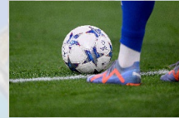
Anstoß 1. Halbzeit