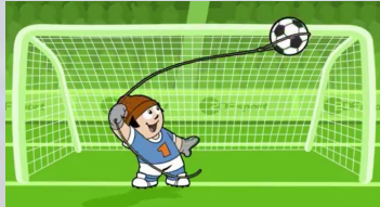
Ende klassische Werbeinsel

Exklusiv-Splitscreen vor Anstoß und in der Halbzeitpause für noch mehr Aufmerksamkeit