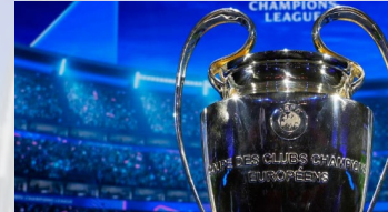
UEFA Champions League- Finale™